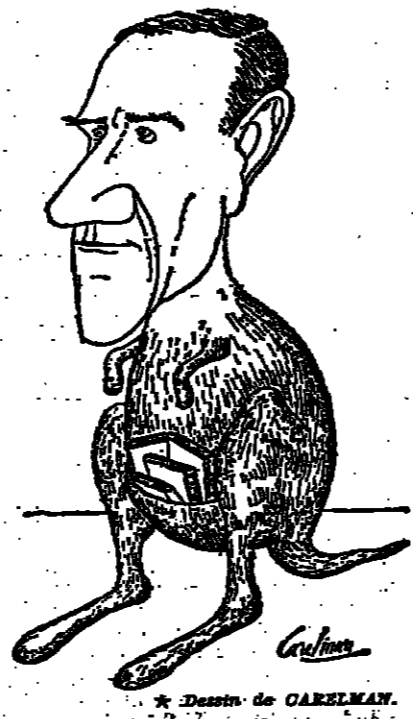
Dessein de CARSLMAN.